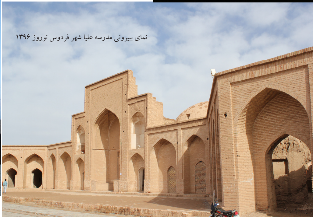
نمای بیرونی مدرسه علیا شهر فردوس نوروز ۱۳۹۶