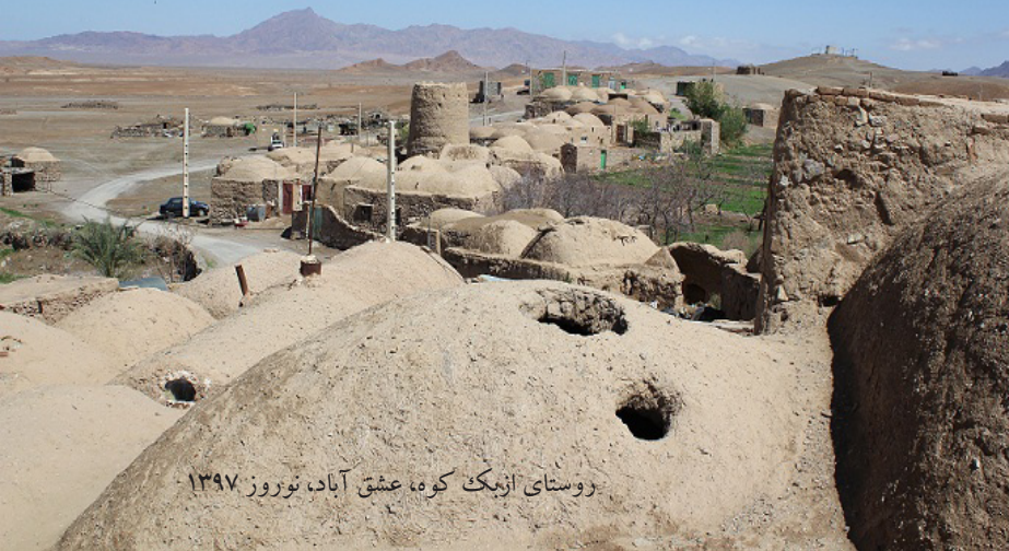
روستای ازبک کوه، عشق آباد، نوروز ۱۳۹۷