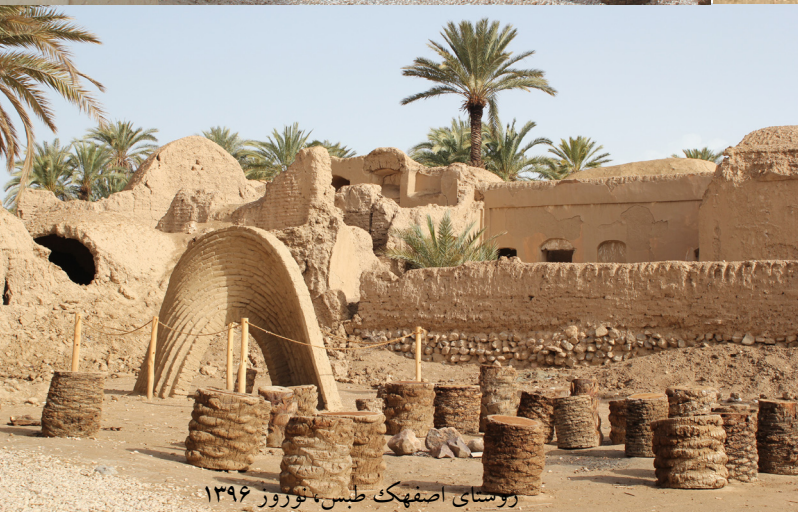
روستای اصفهک طیس، نوروز ۱۳۹۶