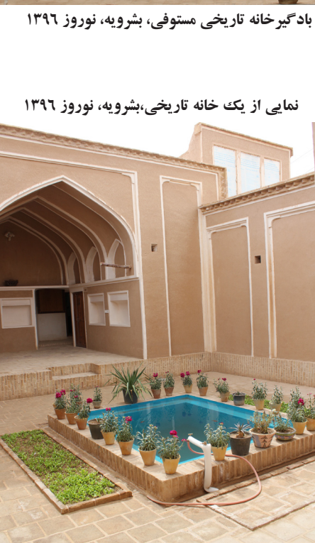
نمایی از یک خانه تاریخی، بشرویه، نوروز ۱۳۹۶