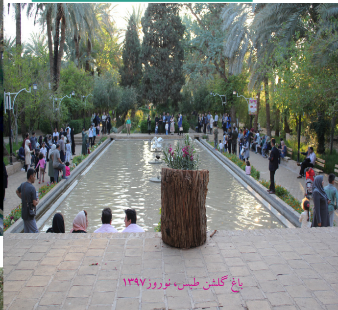
باغ گلشن طبس، نوروز ۱۳۹۷