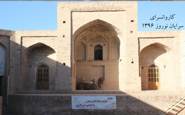
کاروانسرای سرایان نوروز ۱۳۹۶