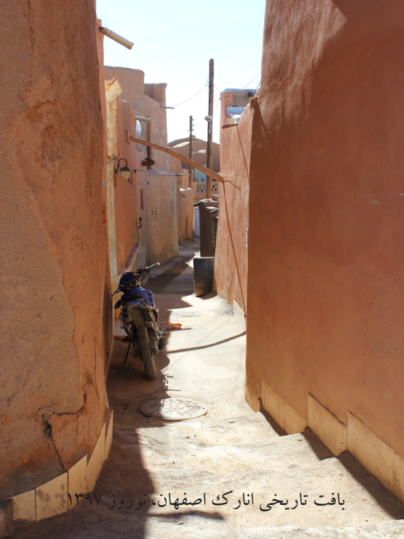
بافت تاریخی انارک اصفهان، نوروز ۱۳۹۷