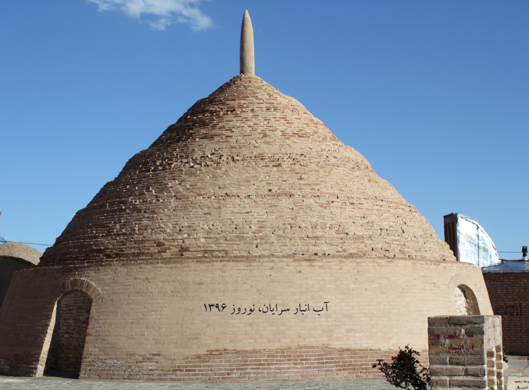
آب انبار سرایان، نوروز ۱۳۹۶