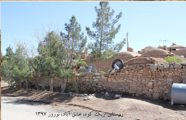
روستای ازبک کوه، عشق آباد، نوروز ۱۳۹۷