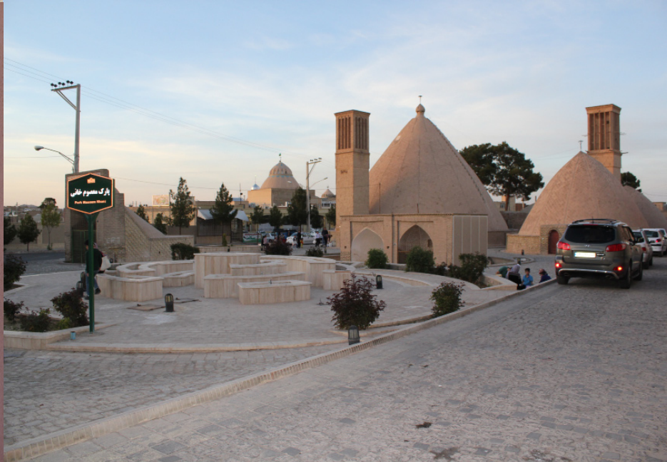
ناین شهر آب انبارها، نوروز ۱۳۹۷