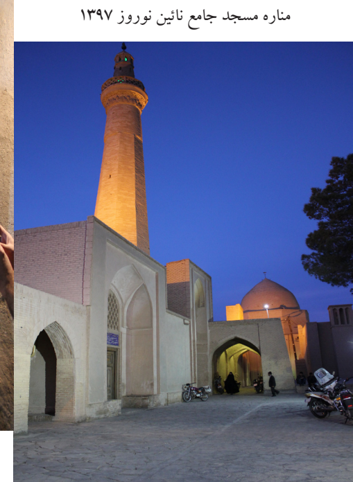
مناره مسجد جامع نائین نوروز ۱۳۹۷