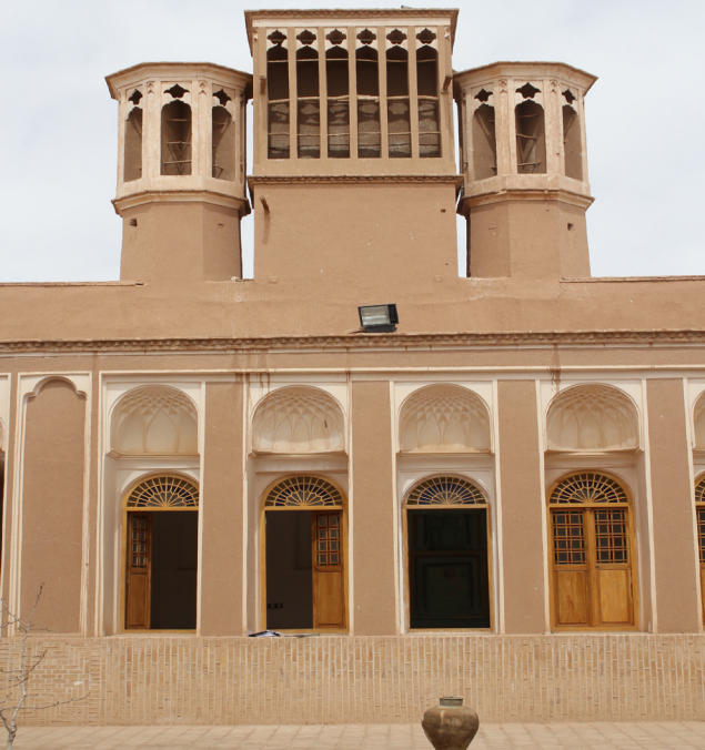
بادگیر خانه تاریخی مستوفی، بشرویه، نوروز ۱۳۹۶