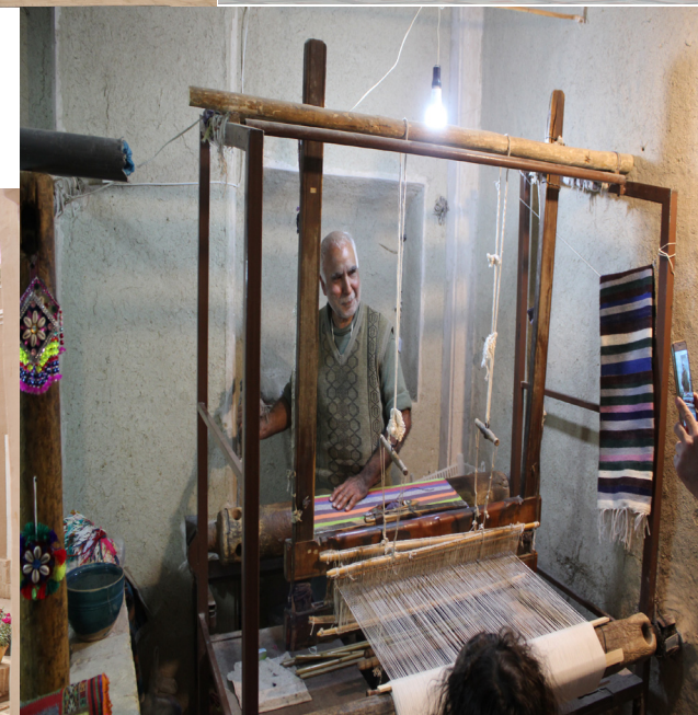
کارگاه صنایع دستی، نائین، نوروز ۱۳۹۷