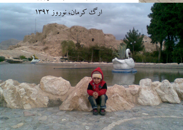
ارگ کرمان، نوروز ۱۳۹۲