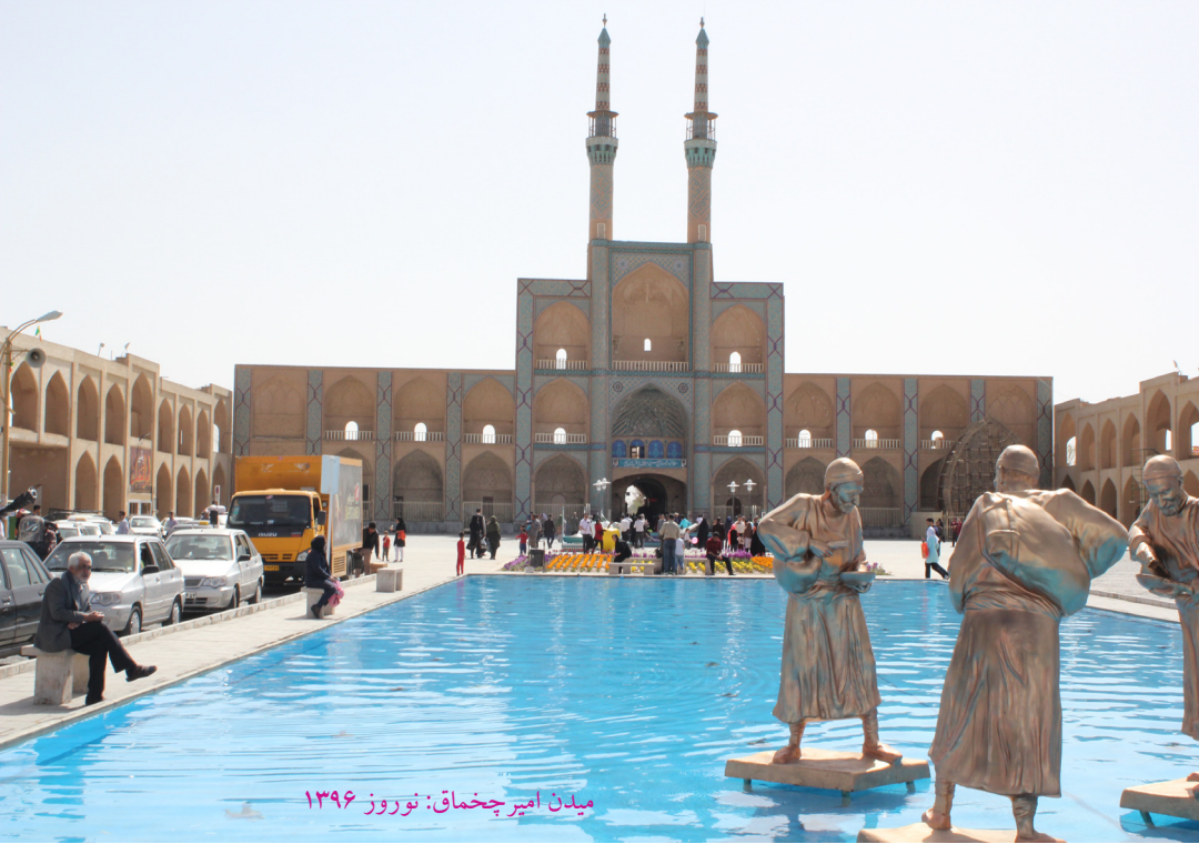
میدان امیر چخماق: نوروز ۱۳۹۶