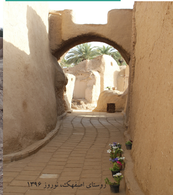
روستای اصفهک، نوروز ۱۳۹۶

شهر تاریخی تون که بر اثر زلزله در سال ۱۳۴۷ به تلی از خاک تبدیل شد، نوروز ۱۳۹۶