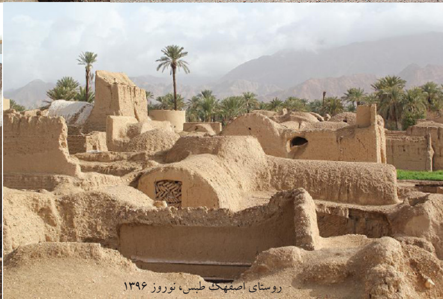
روستای اصفهک طیس، نوروز ۱۳۹۶