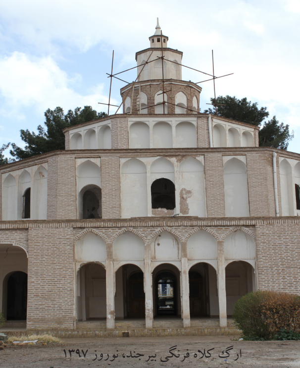
ارگ کلاه فرنگی بیرجند، نوروز ۱۳۹۷