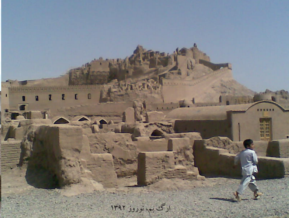
ارگ بم، نوروز ۱۳۹۲