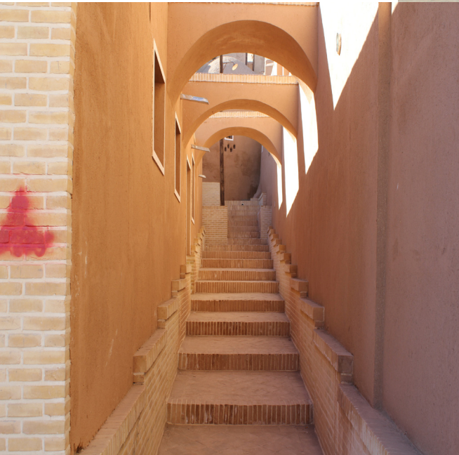
بافت بلکانی معابر انارک اصفهان، نوروز ۱۳۹۷