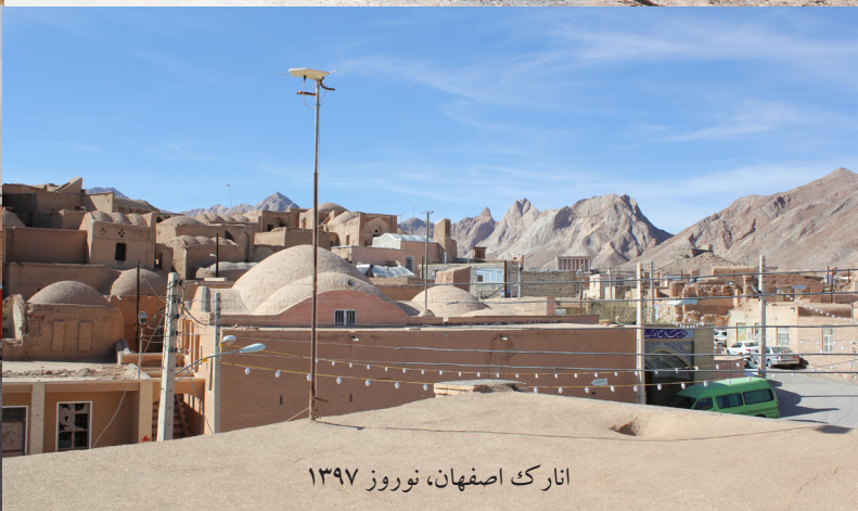
انارک اصفهان، نوروز ۱۳۹۷