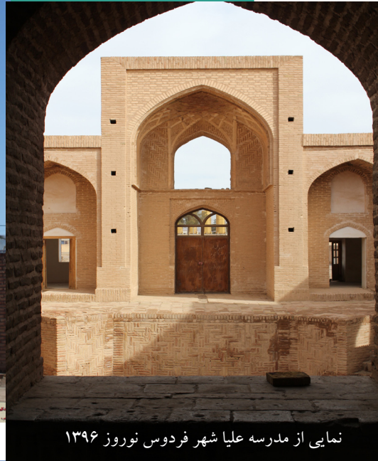
نمایی از مدرسه علیا شهر فردوس نوروز ۱۳۹۶