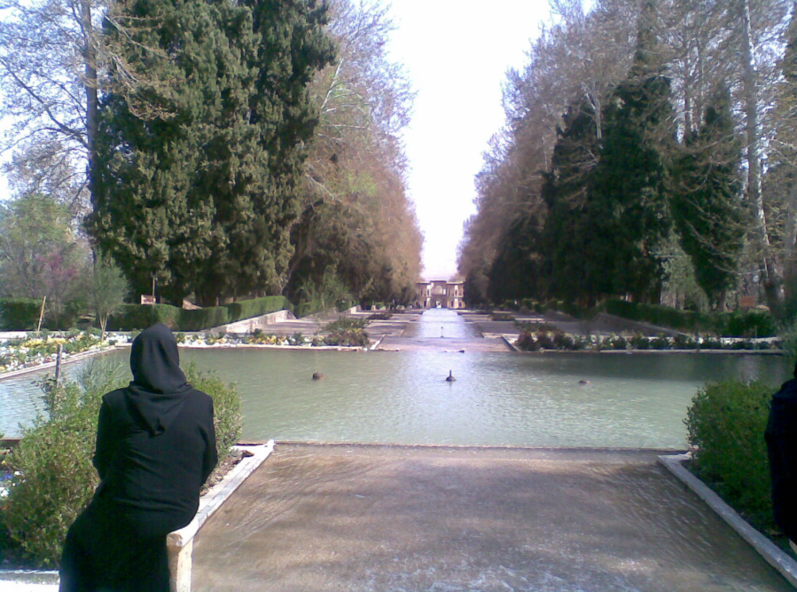
باغ شازده ماهان کرمان، نوروز ۱۳۹۲