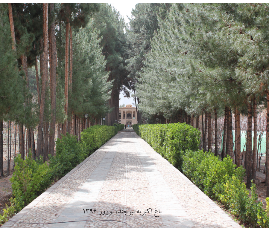
باغ اکبریه بیرجند، نوروز ۱۳۹۶