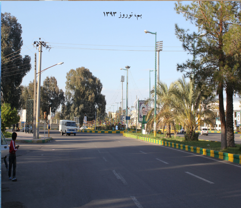
بم، نوروز ۱۳۹۳