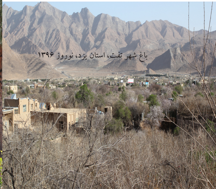
باغ شهر تفت، استان یزد، نوروز ۱۳۹۶