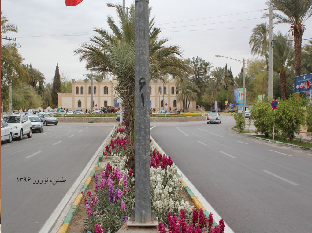
طیس، نوروز ۱۳۹۶