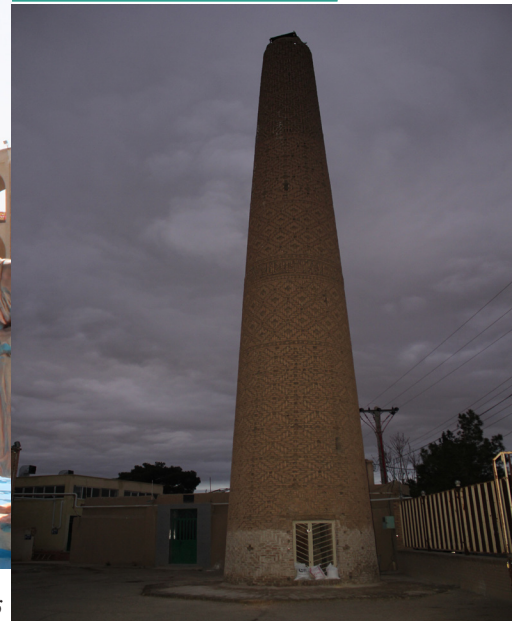
مناره مسجد تاریخانه دامغان نوروز ۱۳۹۶