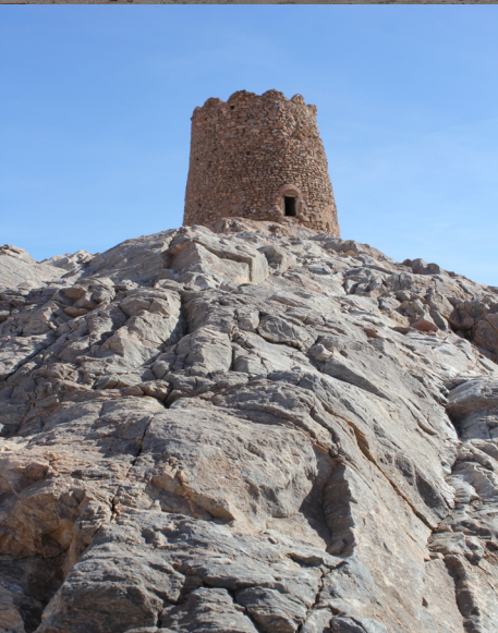
دژ انارک اصفهان، نوروز ۱۳۹۲