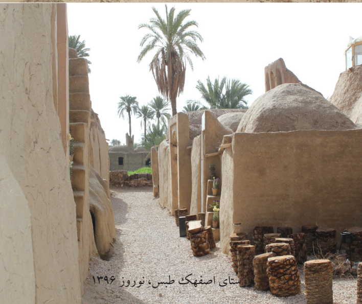
سنای اصفهک طیس، نوروز ۱۳۹۶