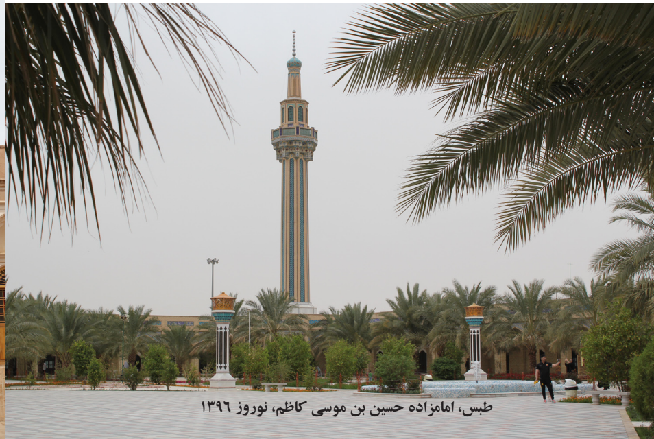
طیس، امامزاده حسین بن موسی کاظم، نوروز ۱۳۹۶