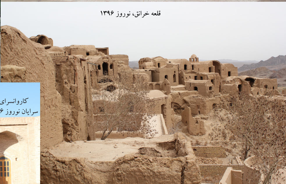
قلعه خراتق، نوروز ۱۳۹۶