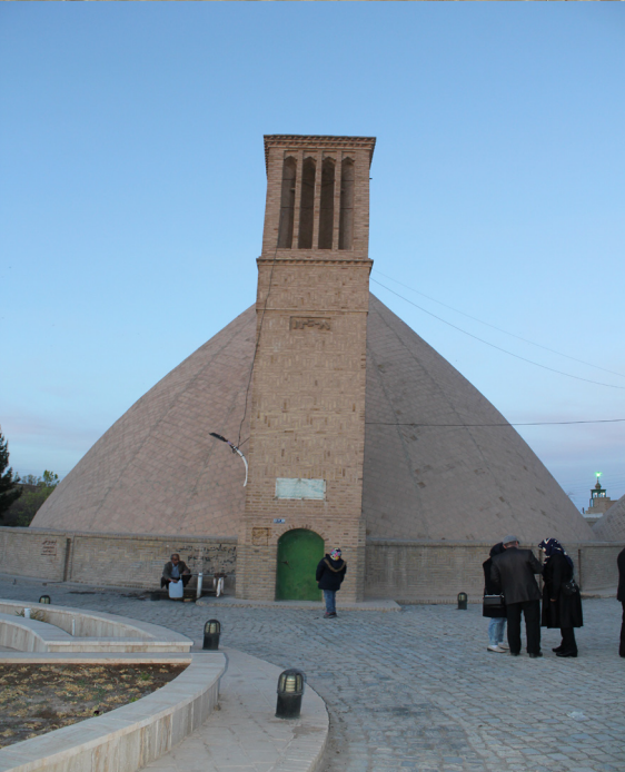
نمایی از آب انبار دارای بادگیر ناین، نوروز ۱۳۹۷