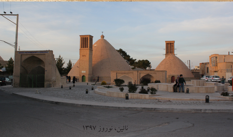
نائین، نوروز ۱۳۹۷