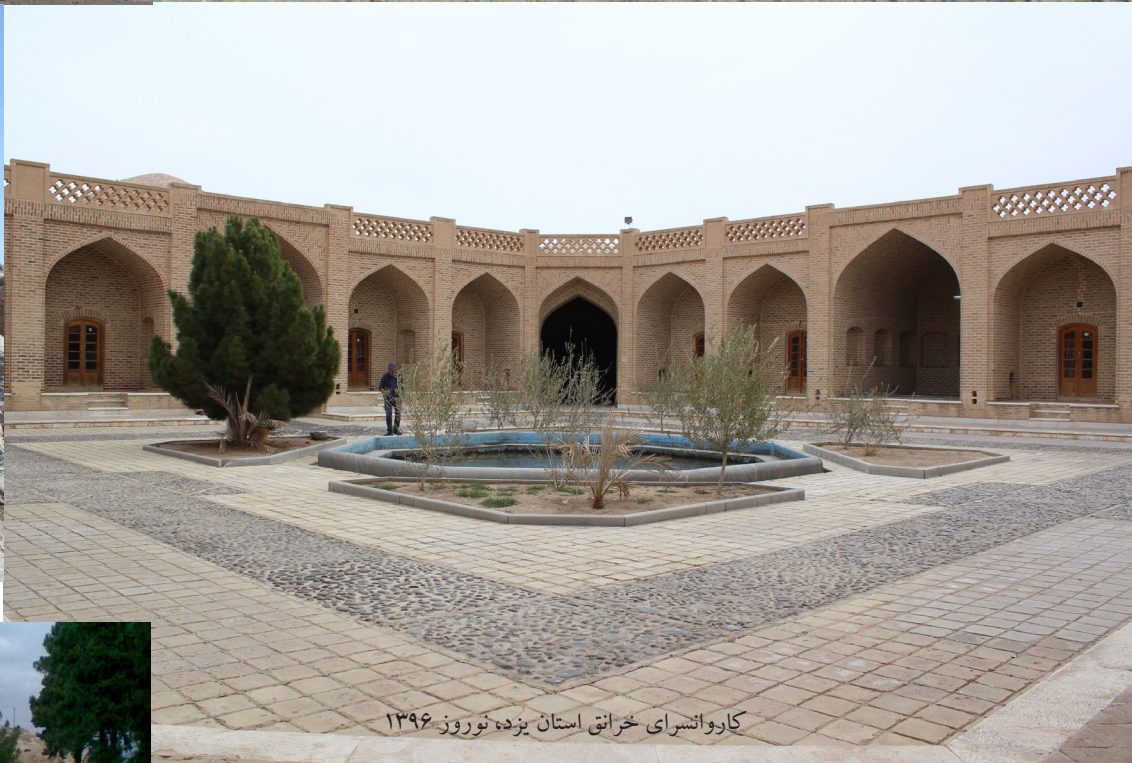
کاروانسرای خراتق استان یزده نوروز ۱۳۹۶