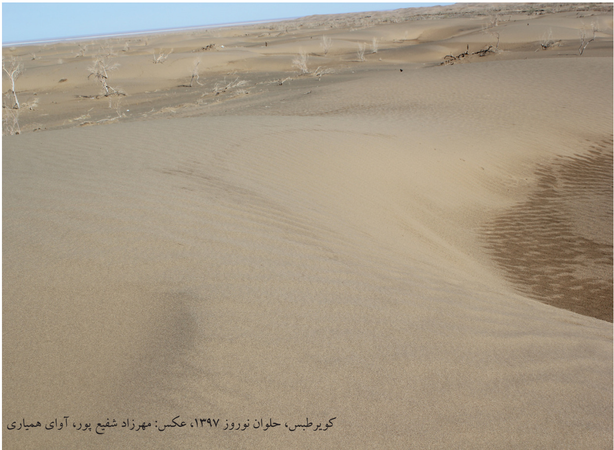
کویر طبس، حلوان نوروز ۱۳۹۷، عکس: مهرزاد شفیع پور، آوای همیاری