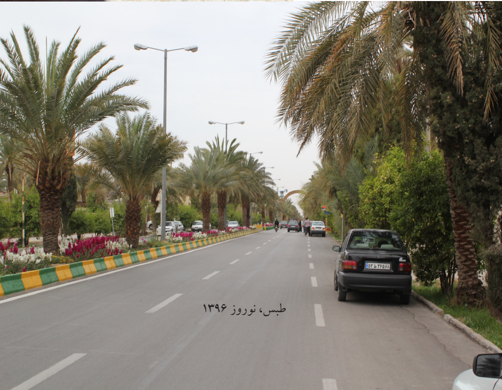
طیس، نوروز ۱۳۹۶