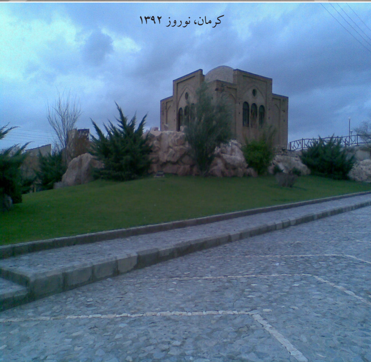
کرمان، نوروز ۱۳۹۲